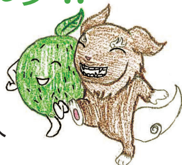
Illustration / 龍磨透